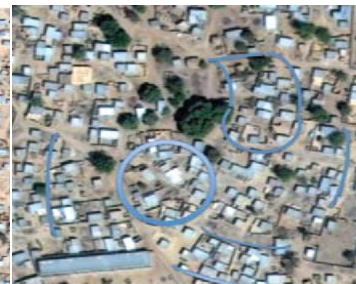
Tissu urbain à dominante CONCENTRIQUE