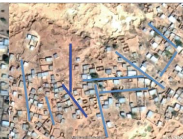
Tissu urbain à dominante DISPERSEE

Des projets réalistes, fondés sur la morphologie des tissus urbains des quartiers sous-intégrés