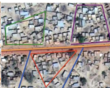
Tissu urbain à dominante LINEAIRE