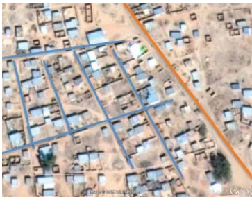
Tissu urbain à dominante RETICULEE