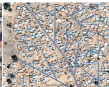
Tissu urbain à dominante ARBORESCENTE